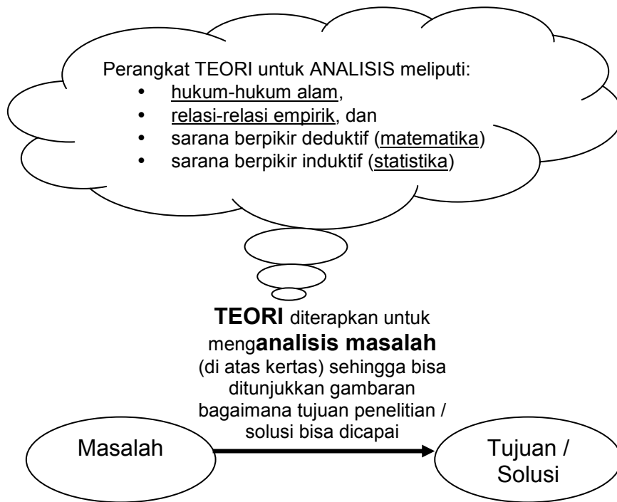
Gambar 1. Posisi Teori dalam kerangka penelitian

Pendekatan teoretik mengungkapkan rangkaian logis pemikiran untuk menyelesaikan masalah dengan berbekal teori-teori ilmiah yang relevan. Bekal teori tersebut meliputi: